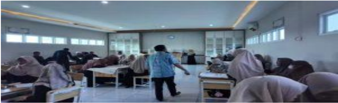
Gambar 2. Kondisi Pelatihan Konten Citra Sekolah Madrasah Tsanawiyah Azzidin Medan

Pelatihan kedua adalah melakukan pelatihan proses evaluasi dan pengawasan pemasaran konten citra sekolah Madrasah Tsanawiyah Azzidin Medan yang merupakan kolaborasi antara Universitas Mikroskil dan Universitas Battuta yang dilakukan dengan metode ceramah dan simulasi praktik, dimana pelatihan ini dilakukan untuk memahami dan mengetahui cara melakukan proses evaluasi dan pengawasan pemasaran konten citra sekolah Madrasah Tsanawiyah Azzidin Medan. Pelatihan ini dilakukan melalui proses identifikasi kondisi awal pengelolaan konten pemasaran sekolah, pelaksanaan secara tatap muka dan/atau daring dengan pendekatan partisipatif. Materi disampaikan secara sistematis, seperti pengenalan konsep evaluasi pemasaran konten, pelatihan teknik evaluasi konten digital, pengenalan sistem pengawasan konten. Dari hasil evaluasi yang ada melalui pelatihan yang dilakukan, maka sebanyak 73% dapat menerapkan proses evaluasi dan pengawasan pemasaran konten citra sekolah. Kondisi ini dapat dilihat pada gambar berikut: