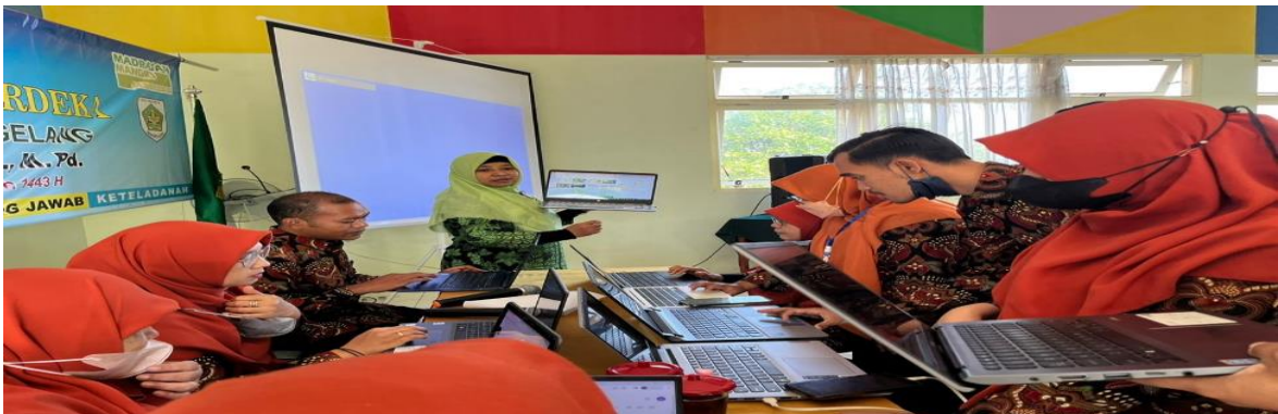
Gambar 3. Kondisi Pelatihan Proses Evaluasi dan Pengawasan Pemasaran Konten Citra Sekolah Madrasah Tsanawiyah Azzidin Medan.

Pelatihan kedua adalah melakukan pelatihan proses evaluasi dan pengawasan pemasaran konten citra sekolah Madrasah Tsanawiyah Azzidin Medan yang merupakan kolaborasi antara Universitas Mikroskil dan Universitas Battuta yang dilakukan dengan metode ceramah dan simulasi praktik, dimana pelatihan ini dilakukan untuk memahami dan mengetahui cara melakukan proses evaluasi dan pengawasan pemasaran konten citra sekolah Madrasah Tsanawiyah Azzidin Medan. Pelatihan ini dilakukan melalui proses identifikasi kondisi awal pengelolaan konten pemasaran sekolah, pelaksanaan secara tatap muka dan/atau daring dengan pendekatan partisipatif. Materi disampaikan secara sistematis, seperti pengenalan konsep evaluasi pemasaran konten, pelatihan teknik evaluasi konten digital, pengenalan sistem pengawasan konten. Dari hasil evaluasi yang ada melalui pelatihan yang dilakukan, maka sebanyak 73% dapat menerapkan proses evaluasi dan pengawasan pemasaran konten citra sekolah. Kondisi ini dapat dilihat pada gambar berikut: