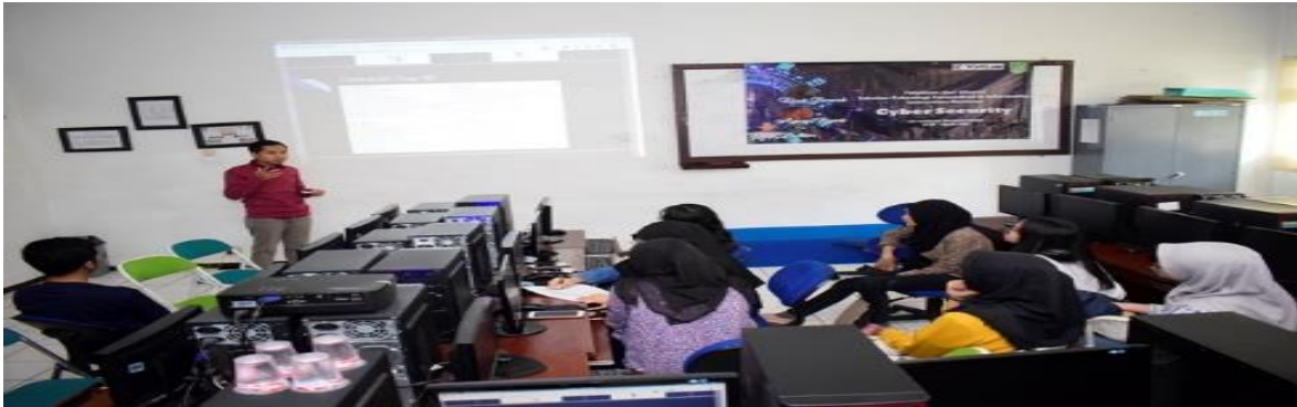
Gambar 4. Kondisi Pelatihan Praktik Penggunaan Aplikasi Perlindungan dan Keamanan Data Madrasah Tsanawiyah Azzidin Medan

Pelatihan keempat, yaitu pelatihan pemahaman etika, pemahaman aturan dan aspek hukumnya dalam penerapan etika, privasi data siswa dan perlindungan anak yang dilakukan melalui ceramah dan diskusi oleh assessor di Fakultas Hukum Universitas Putra Abadi Langkat, dimana materi pelatihannya melalui pemahaman etika dalam lingkungan pendidikan digital, pemahaman aturan dan regulasi terkait privasi data melalui penerapan Undang-Undang Nomor 27 Tahun 2022 tentang Perlindungan Data Pribadi, serta pemahaman perlindungan anak melalui Undang-Undang Nomor 27 Tahun 2022, serta Undang-Undang Nomor 23 Tahun 2002 tentang perlindungan anak, dimana dalam praktiknya isu tersebut masih belum diatur secara khusus di dalam UU ini, sehingga aspek perlindungan data pribadi anak seringkali dirujuk pada peraturan lain, khususnya UU Perlindungan Data Pribadi. Setelah selesainya pelatihan dari 40 orang yang melakukan pelatihan, sebanyak 75% memahami etika, aturan dan aspek hukumnya dalam penerapan etika, privasi data siswa dan perlindungan anak. Situasi ini dapat dilihat pada gambar berikut ini: