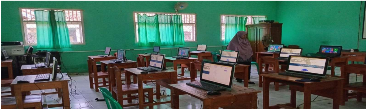
Gambar 1. Kondisi Sistem dan Fasilitas Jaringan Pemasaran Digital Di Madrasah Tsanawiyah Azzidin Medan

Dari gambar di atas terlihat bahwa sistem dan fasilitas online di Madrasah Tsanawiyah Azzidin Medan masih ada yang belum terproteksi dengan perlindungan dan pengamanan data, sehingga sulit bagi guru dan marketing sekolah untuk menggunakan sistem perlindungan dan keamanan dalam proteksi data siswa yang mengancam privasi siswa, sehingga dibutuhkan pelatihan dan pengembangan kemampuan dalam proses penggunaan sistem proteksi tersebut.